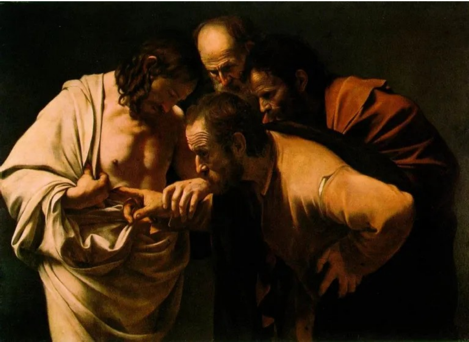
L'incrédulité de saint Thomas, Le Caravage. Vers 1601-1603, huile sur toile, Potsdam