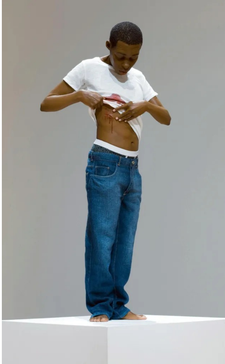
Youth , Ron Mueck, 2009, 91cm, sculpture en silicone et résine polyester recouverte de peinture à l'huile, Fondation Cartier Paris